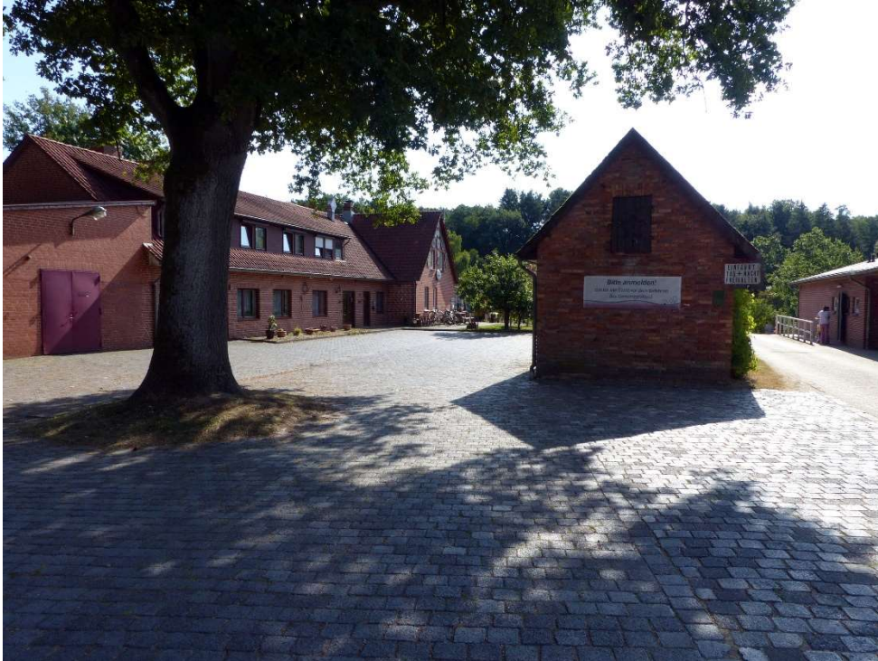
Anmeldung und Campingplatzlokal links, Einfahrt Campingplatz rechts