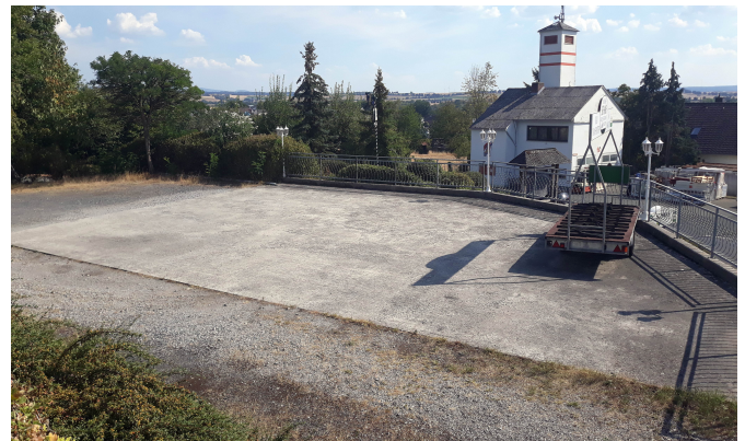
Untester von 3 ebenen Parkplätzen