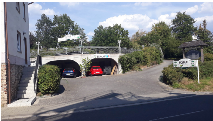
Auffahrt zu den Parkplätzen